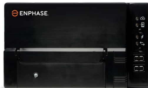
Enphase Envoy en de Enphase micro-omvormer

De opties voor productiemeting en verbruiksbeheer maken de Envoy-S hét platform voor totaal energiebeheer. Het is nu al klaar voor de eventuele energie opslag in de toekomst met een Enphase AC Battery™.